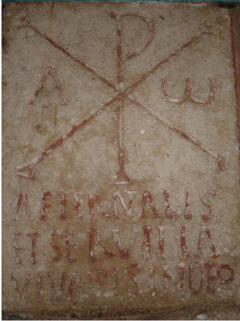
Civaux, église des Saints-Gervais-et-Protais, inscription trouvée en remploi dans le mur extérieur du chevet de l'église.